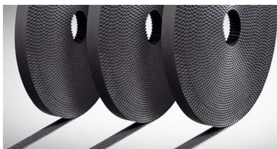
Gumeni linearni zupčasti kaiševi (profili 3M, 5M, 8M i 14M)