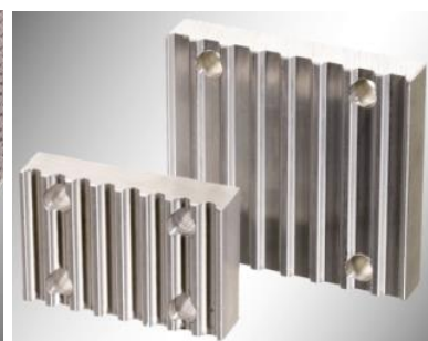
Stezne pločice za osiguranje krajeva kaiša

Primeri primene linearnih zupčastih kaiševa: